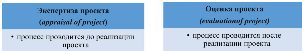
Рисунок 1: Концепции по инвестиционным проектам в Корее [13]

Все эти вышеперечисленные критерии дают полноценную оценку инвестиционного проекта по его эффективности и результативности. Далее рассмотрим основные цели экспертизы проекта, которые состоят из следующих пунктов, указанных на рис.2: